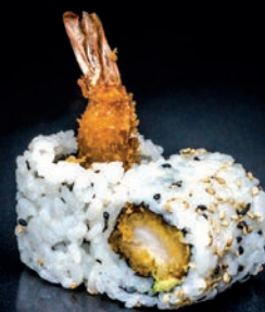
M12 TEMPURA AVOCAT & CREVETTE 8.80€

Préparées avec soin, ces recettes demandent un temps de préparation plus élevé - Vérifiez auprès de votre serveur que le service peut répondre à vos contraintes horaires.