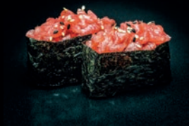
S10 TARTARE DE THON