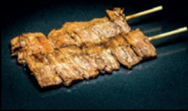
Y5 GYUNIKU BŒUF