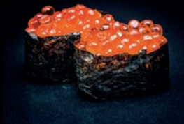
S7 IKURA OEUFS DE SAUMON