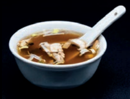
A1 SOUPE MISO

DES RECETTES PLEINES DE FRAÎCHEUR POUR DÉBUTER OU ACCOMPAGNER VOTRE REPAS