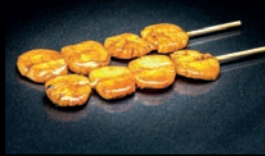
Y10 HOTATE SAINT-JACQUES