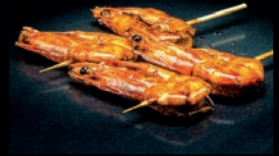
Y12 EBI CREVETTES