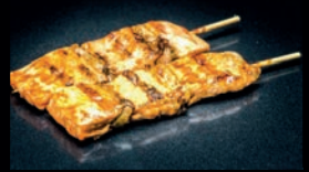
Y8 SHAKE SAUMON