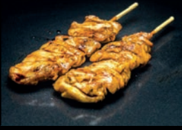
Y1 NEGIMA POULET