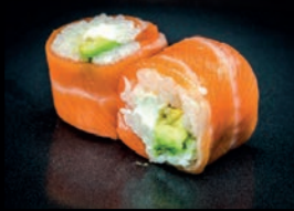
D2 CHEESE AVOCAT