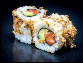
C1 AVOCAT SAUMON

UN ROLL SAUPOUDRÉ D'OIGNONS FRITS CROQUANTS