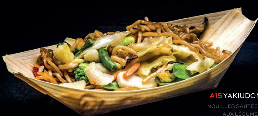
A15 YAKIUDON NOUILLES SAUTÉES AUX LÉGUMES