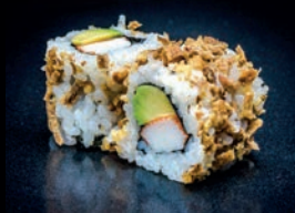
C3 AVOCAT SURIMI