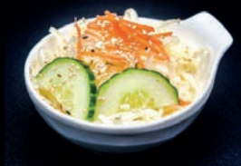
A2 SALADE DE CHOU CONCOMBRE & CAROTTES