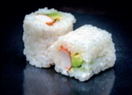
N3 AVOCAT SURIMI