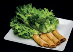
A10 NEMS CREVETTES