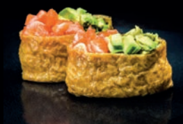
S14 INARI SAUMON AVOCAT & SOJA FRIT