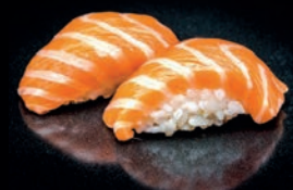
S1 SHAKE SAUMON