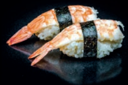
S4 EBI CREVETTE