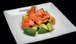
A4 SALADE SAUMON AVOCAT SAUCE SÉSAME