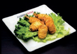
A11B ROULEAUX DE CREVETTES POTATO CRUST