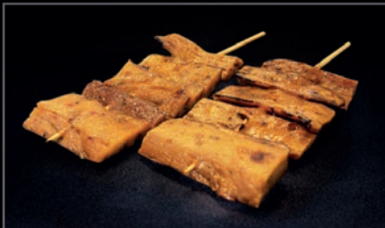
Y14 BROCHETTE ÉMINCÉ VÉGÉTAL AU BLÉ & POIS CHICHE BIO