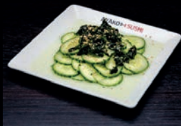
A3 SALADE DE CONCOMBRES AUX ALGUES, SAUCE SÉSAME