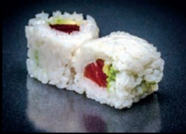
N2 AVOCAT THON