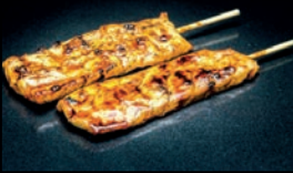
Y9 MAGURO THON