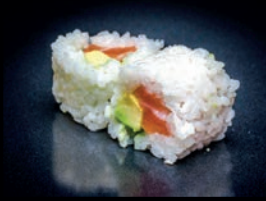
N1 AVOCAT SAUMON