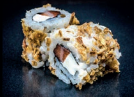
C4 SAUMON CHEESE