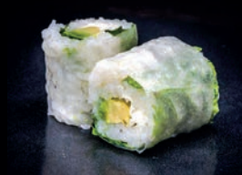
P4 AVOCAT CHEESE