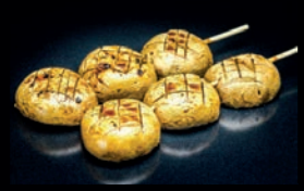
Y4 KINOKO CHAMPIGNONS