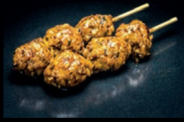
Y2 TSUKUNE BOULETTES DE POULET