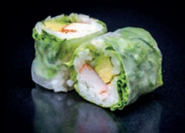
P3 AVOCAT SURIMI