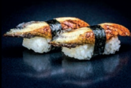
S8 UNAGI ANGUILLE