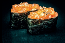
S9 TARTARE DE SAUMON