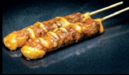
Y6 CHEESE BŒUF AU FROMAGE