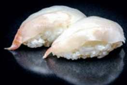
S3 TAI DAURADE