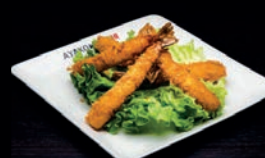
A11 CREVETTES TEMPURA