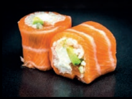
D1 CHEESE AVOCAT & SAUMON

UNE FINE TRANCHE DE SAUMON ROULÉE PLEINE DE SAVEURS