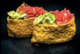
S15 INARI THON AVOCAT & SOJA FRIT