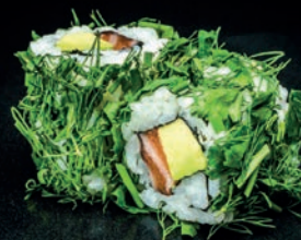
M21 FRESH ROLL SAUMON, AVOCAT & ANETH 8.50€