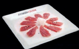
A8 CARPACCIO DE THON SAUCE SÉSAME