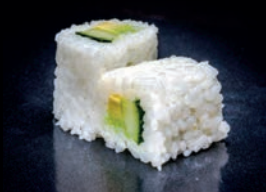
N4 AVOCAT CONCOMBRE