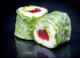
P2 AVOCAT THON