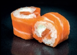
D3 CHEESE SAUMON