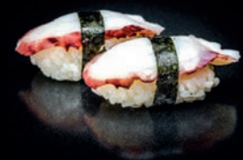
S5 TAKO POULPE