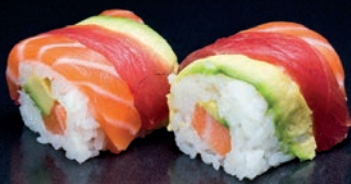
M20 ARC-EN-CIEL SAUMON, THON & AVOCAT 9.50€