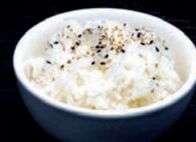
A14 RIZ VINAIGRÉ