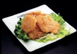
A12 LÉGUMES TEMPURA