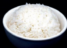
A13 RIZ NATURE