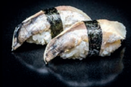
S6 SABA MAQUEREAU