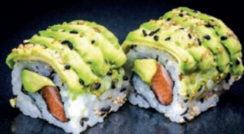
M19 AVOCAT ROLL SAUMON 9.00€