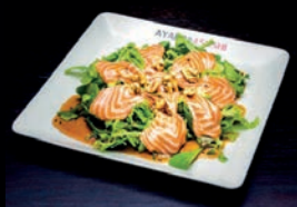
A5 SALADE MAISON NOIX, SAUMON, SAUCE SÉSAME