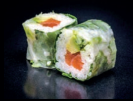
P1 AVOCAT SAUMON

UN VERMICELLE DE RIZ ROULÉ ET GARNI DE MENTHE POUR PLUS DE FRAICHEUR