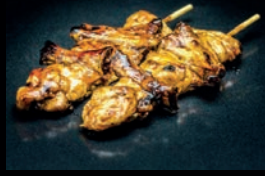
Y3 TEBA AILE DE POULET