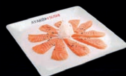
A7 CARPACCIO DE SAUMON SAUCE SÉSAME