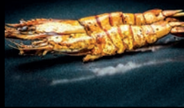
Y11 OEBI GAMBAS