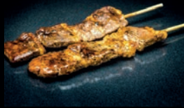
Y7 KAMO CANARD