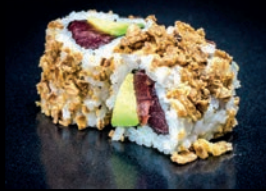
C2 AVOCAT THON