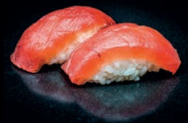
S2 MAGURO THON