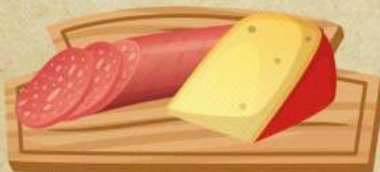
Planche apéro 16,50€ Charcuterie, fromage, 2-3 personnes