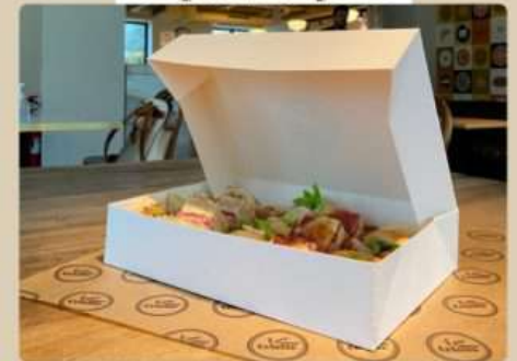
Sur place/À emporter

Commande possible pour 30 pièces minimum