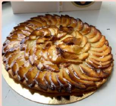
Tarte aux fruits