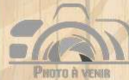
PHOTO À VENIR