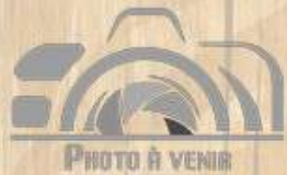
PHOTO À VENIR