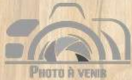
PHOTO À VENIR