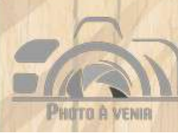
PHOTO À VENIR