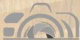
PHOTO À VENIR